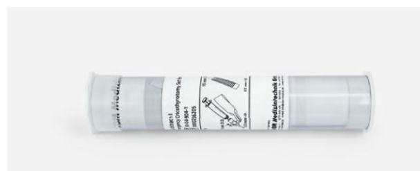
Tube plastique, idéal pour les sacs d'urgence. Dimension : 23 cm (L), Ø 5 cm