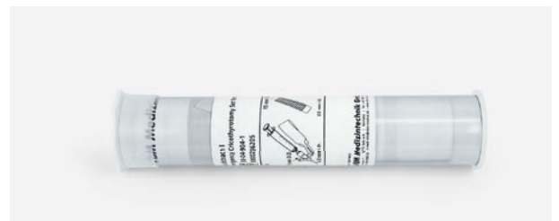
Kunststoffrohr, ideal für Notfalltaschen. Maße: 23 cm (L), Ø 5 cm