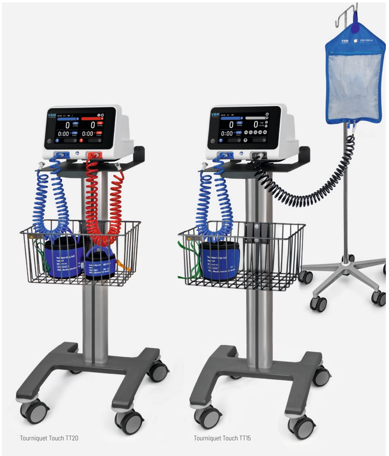
Tourniquet Touch TT20

Para el uso de un manguito simple y la bolsa de infusión.