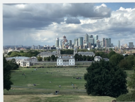
Sprachkurs in London